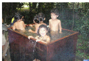
みんなで沸かした五右衛門風呂！