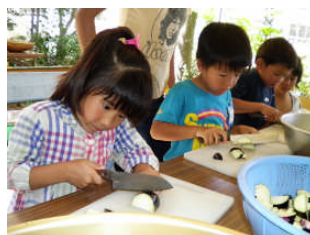
みんなで夜ご飯を作るよ！