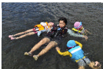
思い思いに泳ぎます！