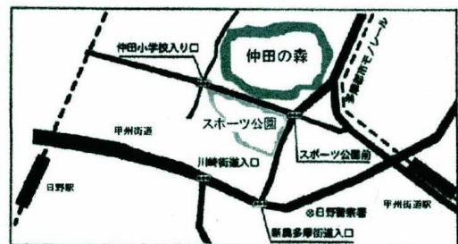
自然体験広場「仲田の森」地図

NPO法人子どもへのまなざしは、「子どもが主人公の居場所作り」を通して、「子どもがいるからつながる人の輪」を広げる活動に取り組んでいます。子どもにとって遊びは生きることそのものです。子どもの「やってみよう！」気持ちを温かいまなざしで支えていくことが大切だと考えています。