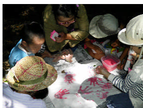
グループの旗作り