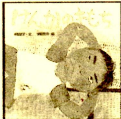
『けんかのきもち』 「もっと話したい子育ての楽しさ」「つれづれAiko」 (以上、りんごの木出版部) 絵本「ぜっこう」「ありがとうのきもち」(以上、ポプラ社) など、他多数の著書があります。